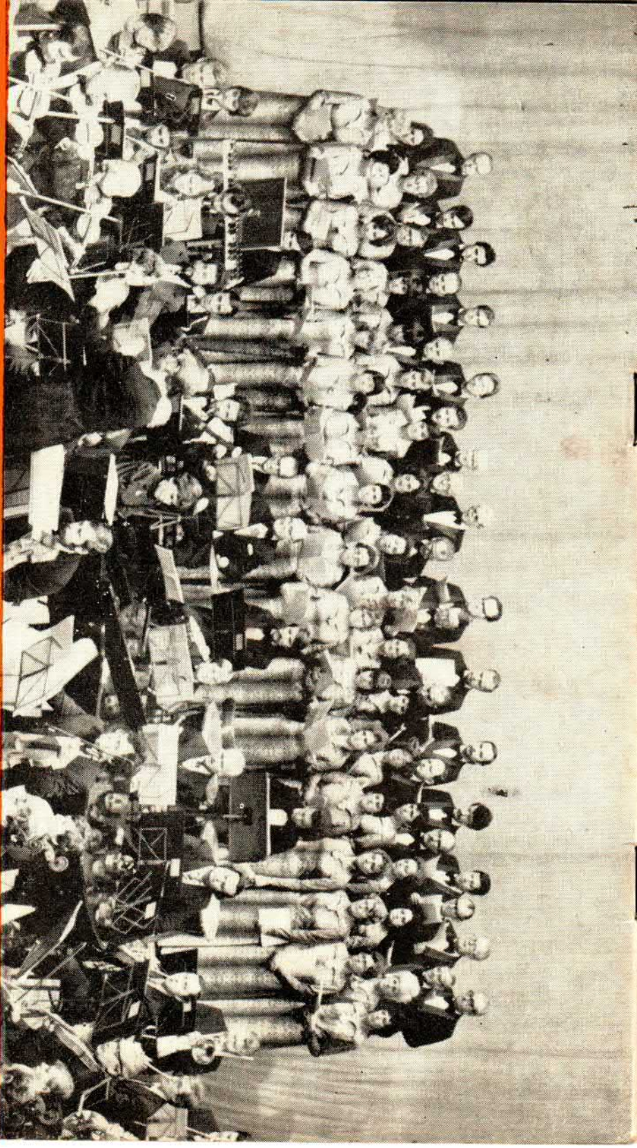
Chór Mieszany „OGNIWO”